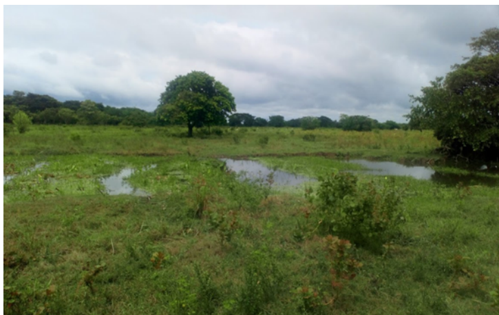
Imagen 3. Zona de intervención con restricciones (vía Tres cruces-Guacamayo)