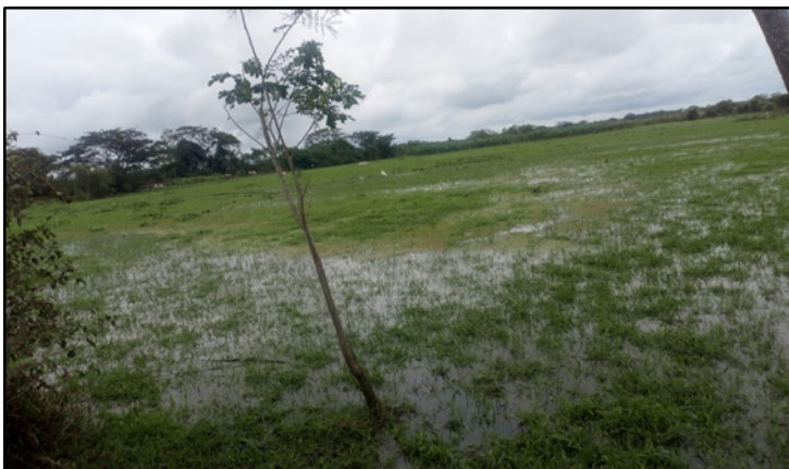
Imagen 4. Trayecto cabecera municipal – Ciénaga Agallal