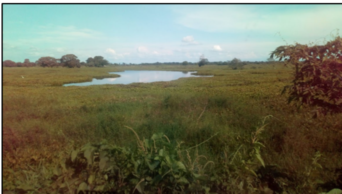
Imagen 1. Zona de intervención con restricciones (vía Majagual-Achí)