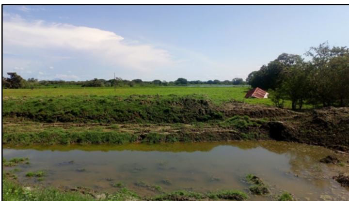
Imagen 2. Zona de intervención con restricciones (vía Achí-Tres Cruces)