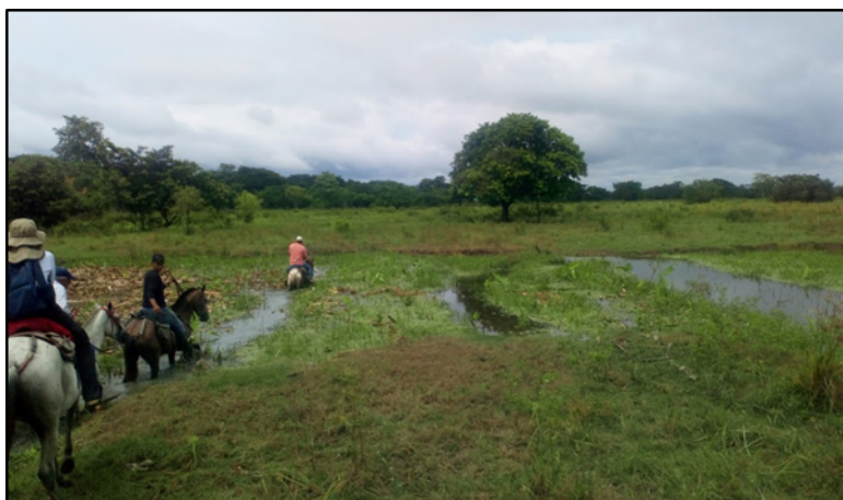
Imagen 5. Trayecto a caballo cabecera municipal – Ciénaga Agallal