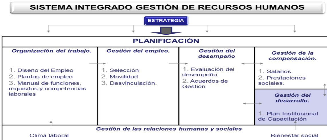
Figura N° 2. Subsistemas de la Gestión del Recursos Humanos. Adaptado de Serlavós, R. tomado de: (Longo, 2002 pág. 15)

Dando cumplimiento con la Planeación Estratégica del Talento Humano, uno de los componentes centrales es la gestión del recurso humano se desarrolla, a través de los siguientes subsistemas: