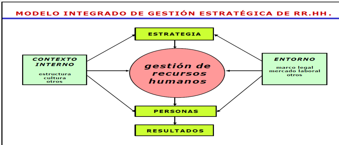
Figura N° 1. Modelo Integrado de Gestión Estratégica del Recurso Humano adaptado de Serlavós, tomado de: (Longo, 2002 pág. 11)