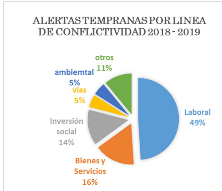
Gráfica N. 3 Alertas Tempranas por línea de conflictividad