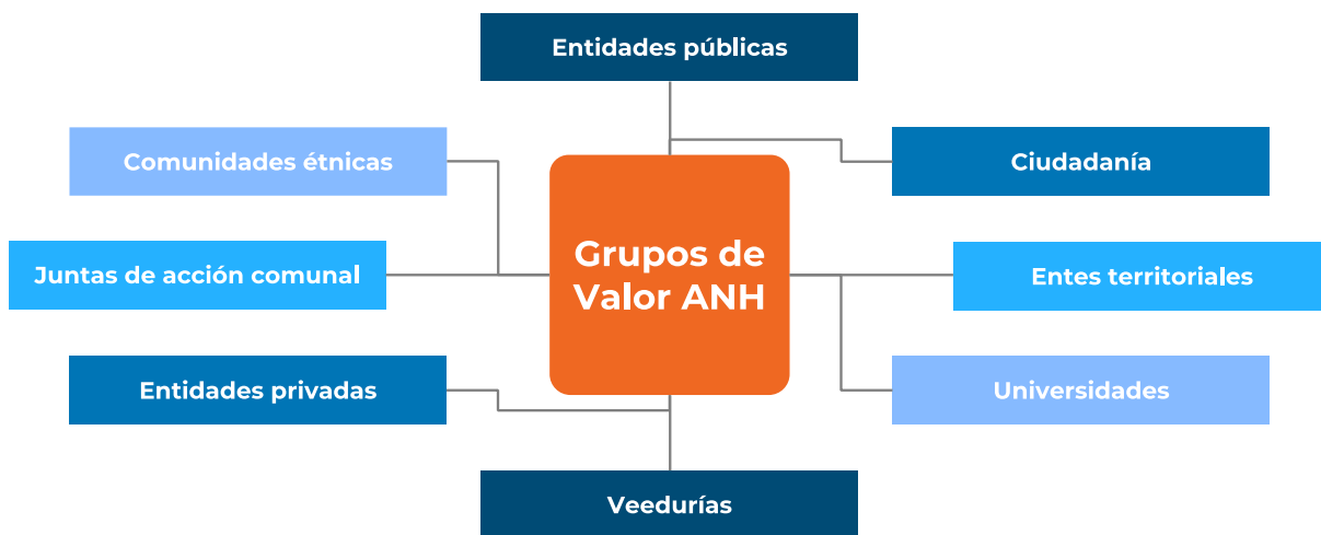
Imagen 2: Grupos de valor de la ANH

En ese sentido, la entidad mediante el proceso de caracterización de grupos de interés ha identificado ocho grupos de relacionamiento, siendo las entidades públicas y la ciudadanía los actores de mayor interacción de acuerdo con el documento de caracterización periodo 2021- 2023.