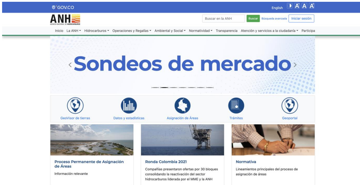
Imagen 3: Página web de la ANH